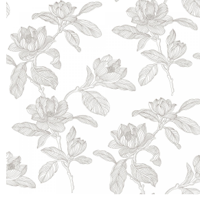
PAEONIA Titanium 98 Motif d'impression