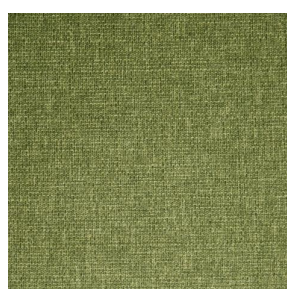
MUNA Olive 61