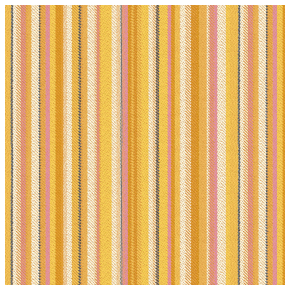
TRAVIS Soleil 127 Motif d'impression