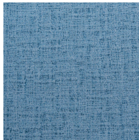
MURA GLACIER 43 Motif d'impression