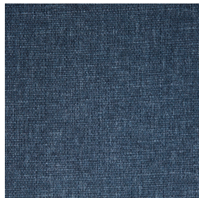
MUNA Indigo 144 Motif d'impression