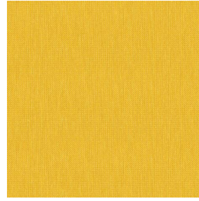
RIVE Jaune 46