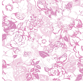
CHARMETTE rose 129 Motif d'impression