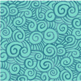
TUMULTE Menthe 122