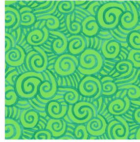
TUMULTE Prairie 125