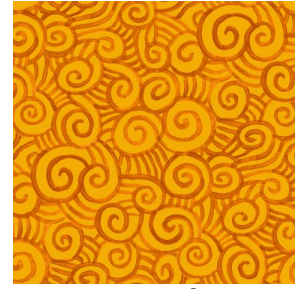
TUMULTE Safran 49