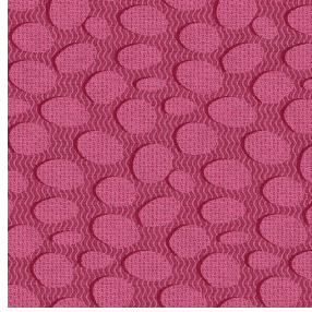
GALET Fuchsia 33 Motif d'impression