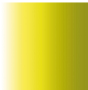
ZENITH Anis 62