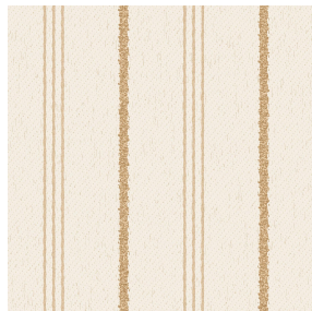
LIAM Naturel 26 Motif d'impression