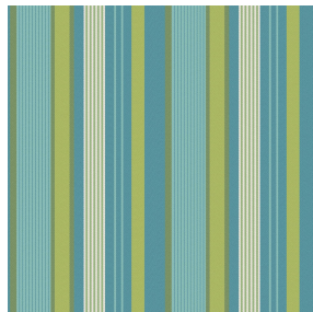
MELANIE Printemps 130 Motif d'impression