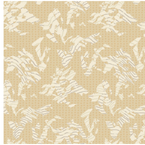
6018 Ocre 03 Motif d'impression