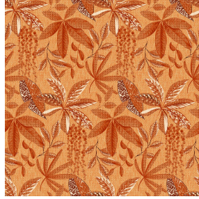
TROPIC Terracotta 65 Motif d'impression