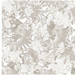
6105 Beige 63 Motif d'impression