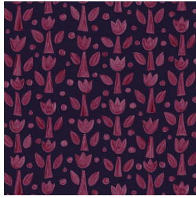
TULIPE Bordeaux 04