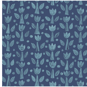
TULIPE Indigo 119 Motif d'impression