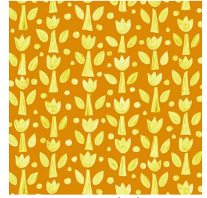
TULIPE Soleil 127