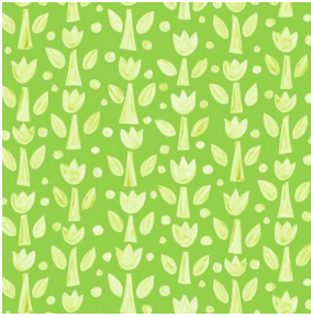
TULIPE Anis 62