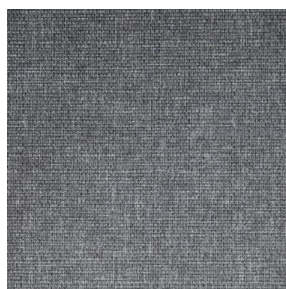
MUNA Graphite 77