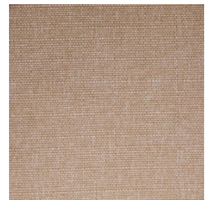
MUNA Saumon 143