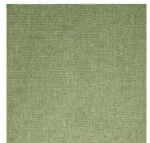
MUNA Tilleul 103