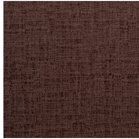
MURA TERRE 107 Motif d'impression