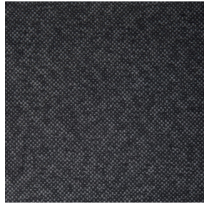
ANATOLE Titanium 98 Motif d'impression