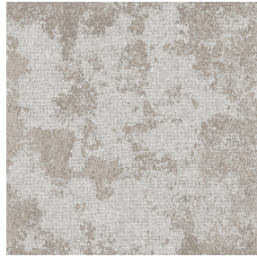
SIERRA ardoise 87 Motif d'impression