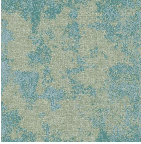
SIERRA brume 47