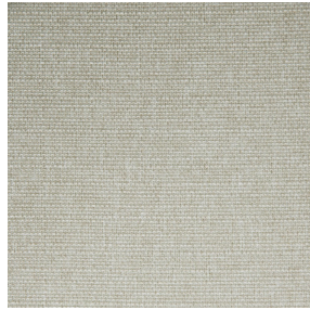
MUNA Coco 142 Motif d'impression