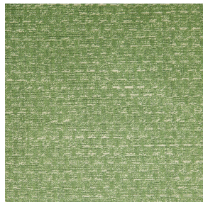
RUSTIC Mousse 92 Motif d'impression