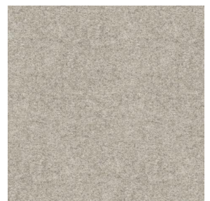
ELAINA Naturel 26