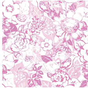
CHARMETTE rose 129 Motif d'impression