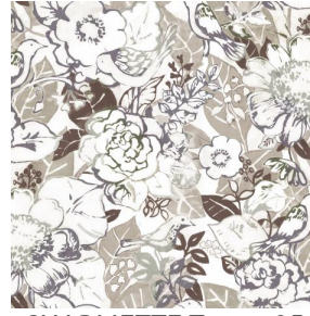
CHARMETTE Taupe 95