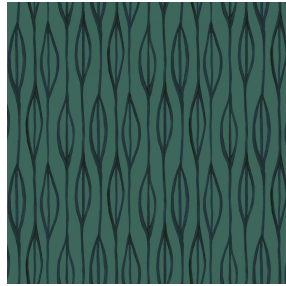
YENDI Sapin 126 Motif d'impression