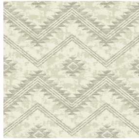
6037 Beige 63 Motif d'impression