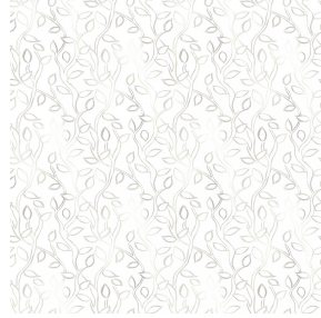
6055 Naturel 26 Motif d'impression