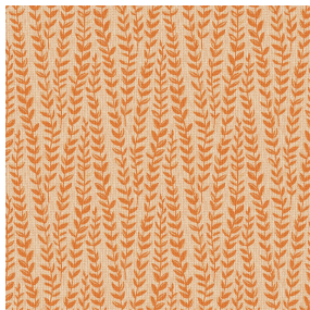
MAELLIE Terracotta 65 Motif d'impression