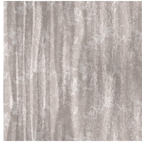
6027 Taupe 95 Motif d'impression