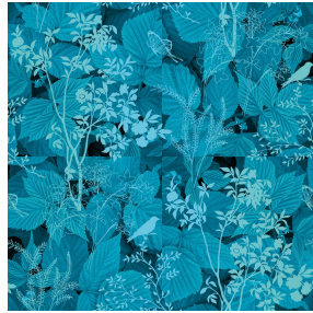
ODE Turquoise 53 Motif d'impression