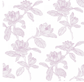
PAEONIA Hortensia 134 Motif d'impression