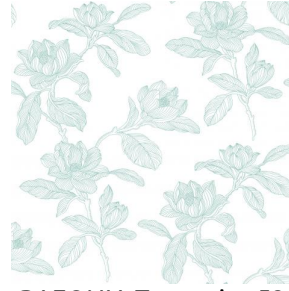
PAEONIA Turquoise 53