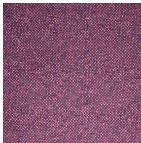
ANATOLE Amarante 108