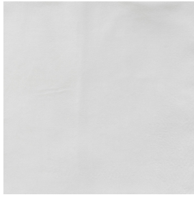
VELTEN BPI 00 Support d'impression