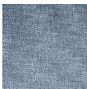
MUNA Tourterelle 138