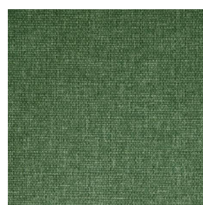
MUNA Lierre 124