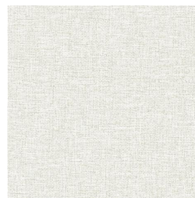
MUNA lin 11