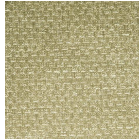
RUSTIC Bergamote 121