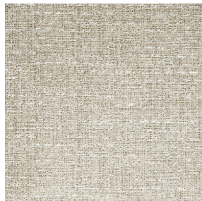
RUSTIC Naturel 26 Motif d'impression