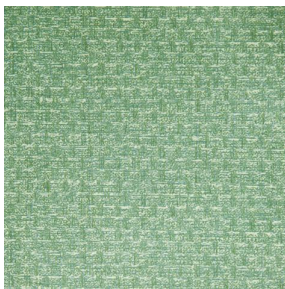
RUSTIC Prairie 125