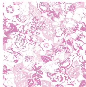
CHARMETTE rose 129