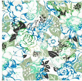
CHARMETTE Turquoise 53 Motif d'impression