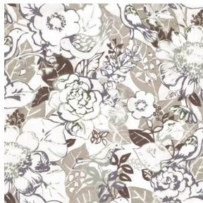
CHARMETTE Taupe 95