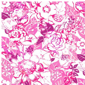
CHARMETTE Fuchsia 33