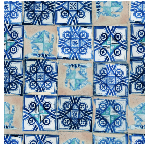
PAOLO Azur 137 Motif d'impression