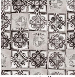
PAOLO Ficelle 09