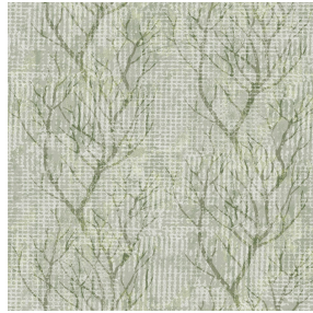
6058 Kaki 148 Motif d'impression