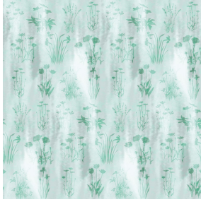
6054 Céladon 135 Motif d'impression