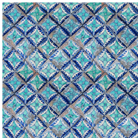
PIETRO Azur 137 Motif d'impression